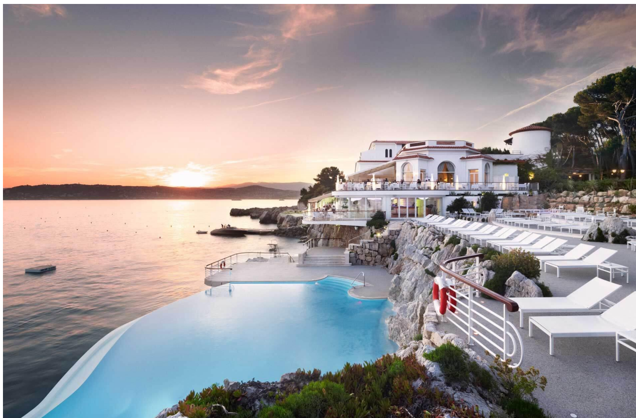
Coucher de soleil sur la piscine de l'Hôtel du Cap-Eden-Roc