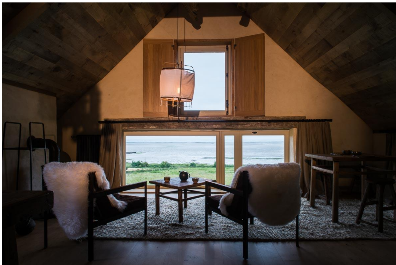
© Ferme du Vent – Maisons de Bricourt