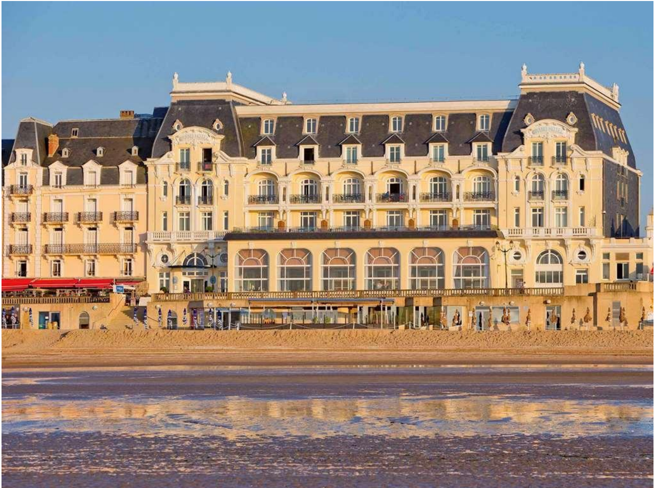
Le Grand Hôtel de Cabourg face à l'Océan

Bon à savoir ? L'hôtel propose dans le cadre de son bar à cocktails un Goûter Proustien , à déguster le regard perdu vers le grand large.