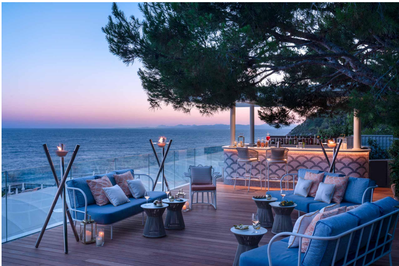
Le Club Dauphin du Grand Hôtel du Cap-Ferrat

Bon à savoir ? Depuis 2015, la gestion du Grand-Hôtel du Cap-Ferrat (5-étoiles classé Palace) est assurée par Four Seasons. Il s'agit de l'un des quatre hôtels de l'enseigne canadienne en France (avec le Four Seasons George V à Paris, le Four Seasons Megève et les Chalets du Mont d'Arbois, toujours à Megève).