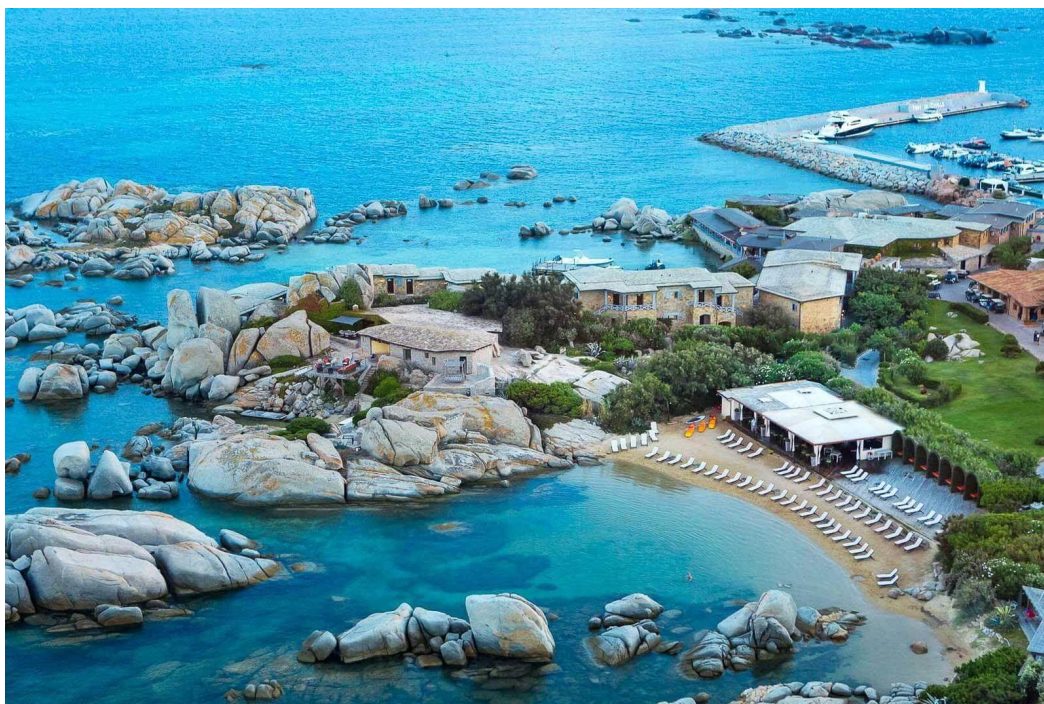
L'Hôtel & Spa des Pêcheurs, seul hôtel de l'île de Cavallo, sans doute la plus luxuriante de l'archipel de Lavezzi