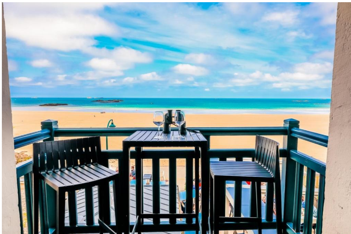
Hôtel Les Charmettes