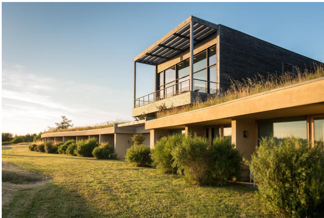
La Gree Des Landes - Eco-Hotel-Spa Yves Rocher