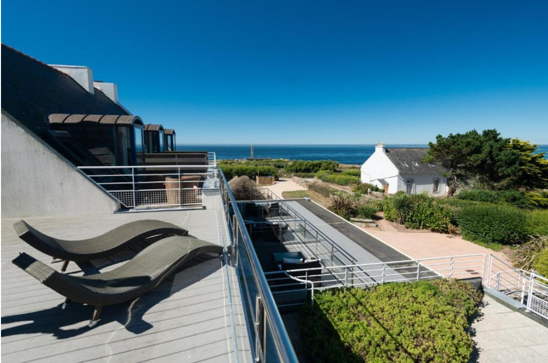
Hostellerie Pointe St-Mathieu