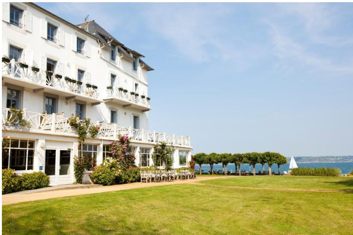
Le Grand Hôtel des Bains