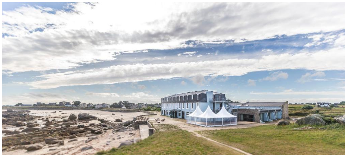
Hôtel de la Mer, The Originals Relais (Relais du Silence)