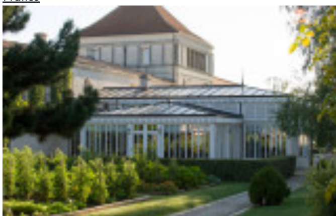
Les Sources de Caudalie Bordeaux France