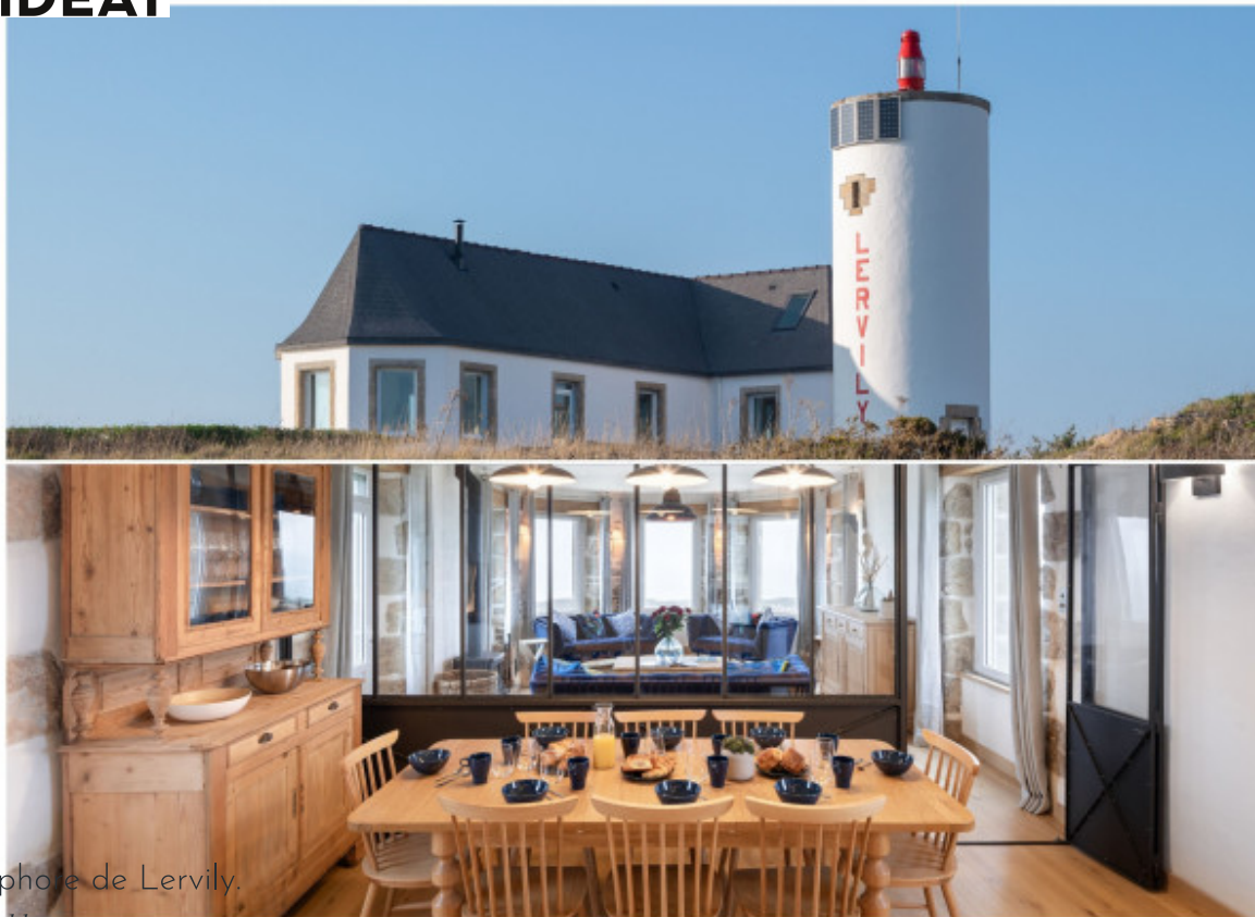
Le sémaphore de Lervily. pascal-leopold