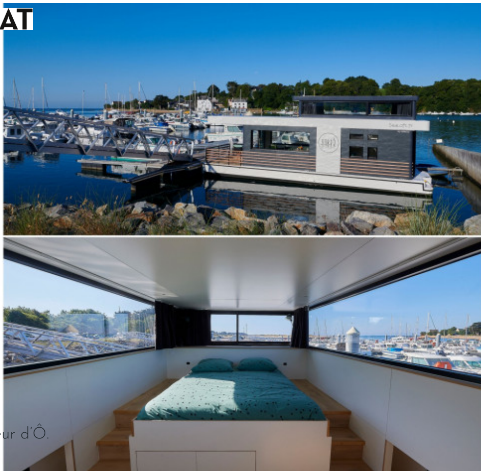
Lodge Boat Fleur d'Ô. Yvan Zedda