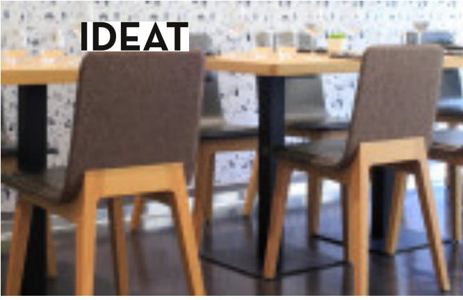
Une Cuisine en ville Bordeaux France