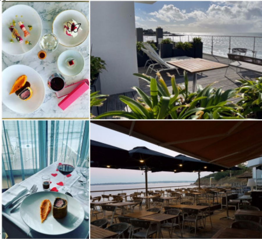
Les Sables blancs.