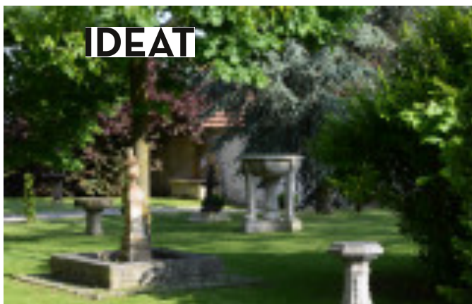
Le Four à Chaux France