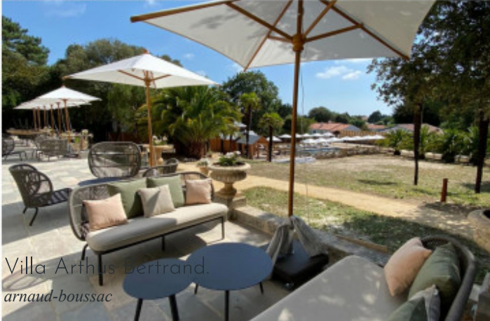
Villa Arthus Bertrand. arnaud-boussac