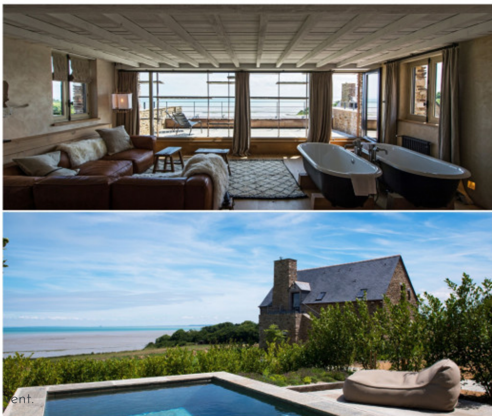
La Ferme du vent.

> Le Buot, 35350 Saint-Méloir-des-Ondes. Tél. : 02 99 89 64 76. Maisons-de-bricourt.com