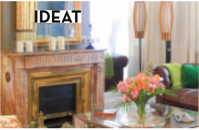
La Course Bordeaux France