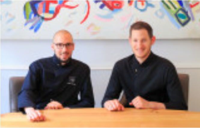
Côté rue Bordeaux France