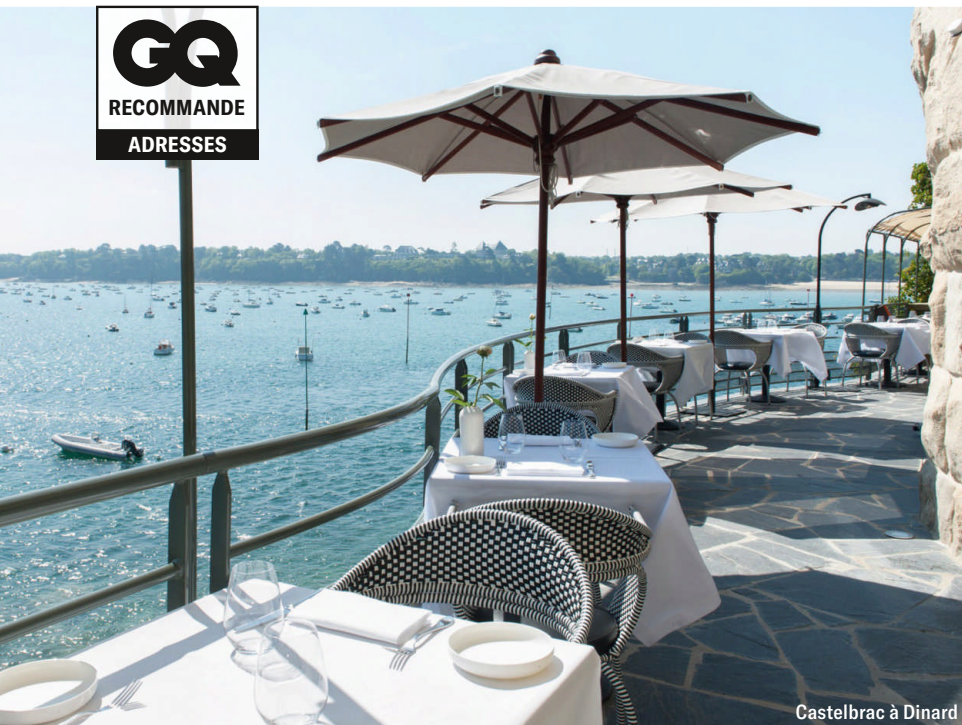
Castelbrac à Dinard