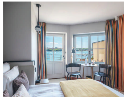
Castelbrac à Dinard

À seulement cinq minutes à pied du vieux port de Marseille, rendez-vous depuis l'une des plus belles vues de la cité phocéenne à l'hôtel Les Bords de Mer. Entièrement orientée vers la Méditerranée, cette adresse s'ajoute à la Collection Les Domaines de Fontenille pilotée par le duo Frédéric Biousse et Guillaume Foucher. Tous les deux ont