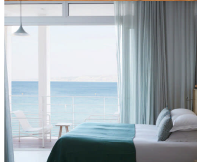
Les Bords de Mer à Marseille