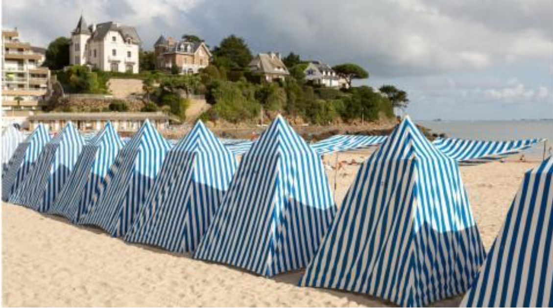
Sur les plages, les cabines à rayures sont chics et bien pratiques.