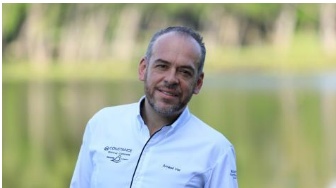
C'est le chef étoilé Arnaud Viel qui assurera la restauration VIP du tournoi.