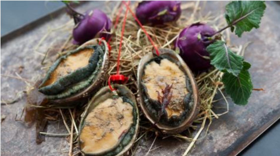
Revisitées, ces huîtres cuites témoignent du talent du chef du Pourquoi Pas.