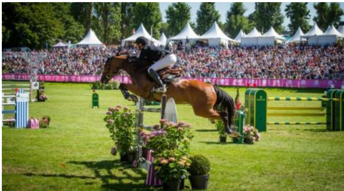
Les amateurs de sports équestres ne manqueront pas les épreuves du Jumping International.