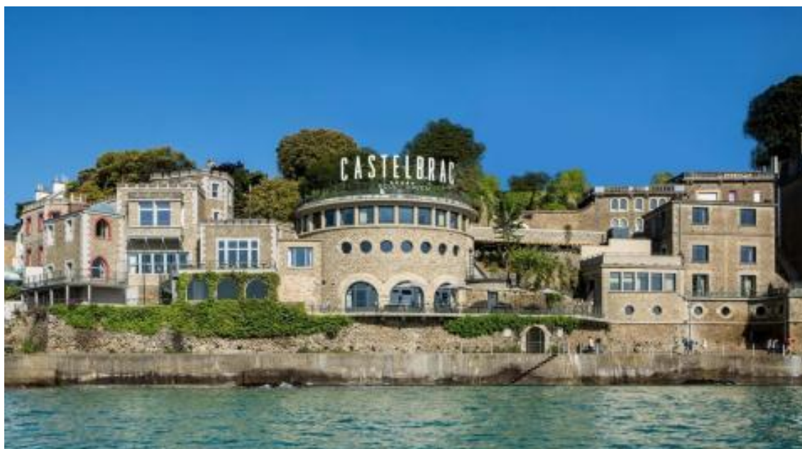
Surplombant la mer, cette somptueuse bâtisse accrochée à sa falaise est le plus luxueux hôtel de Dinard.