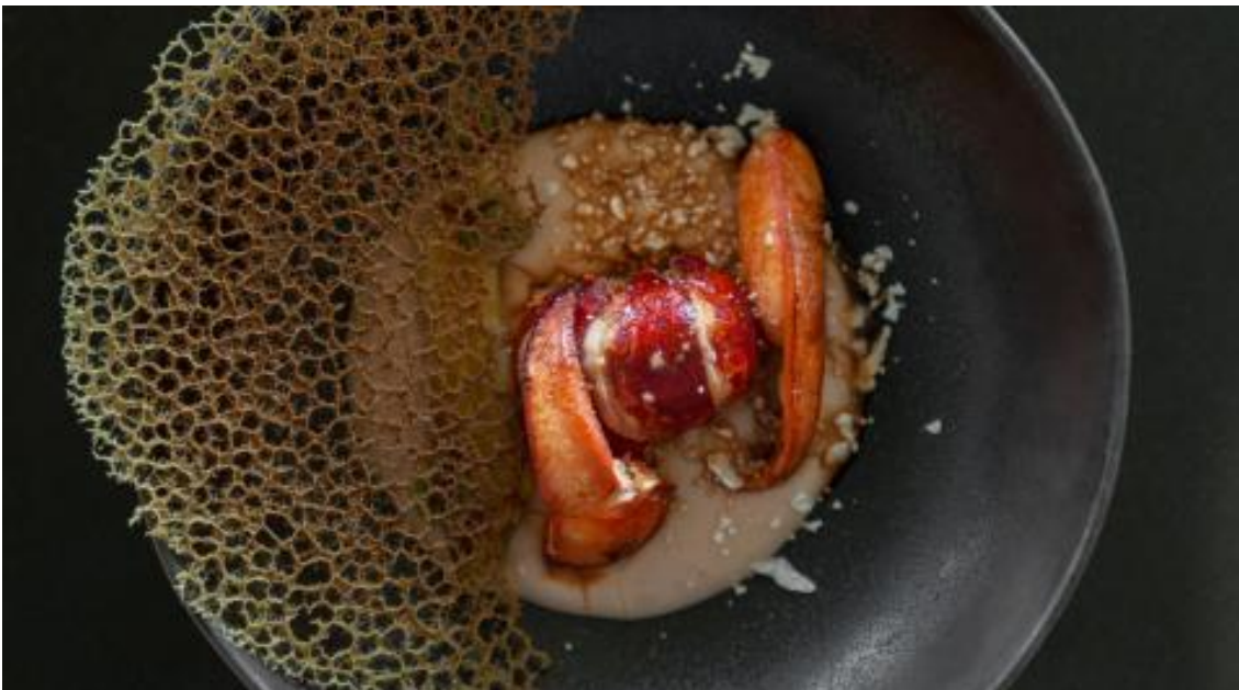
Homard, langoustines, les trésors de la marée sont de première fraîcheur.