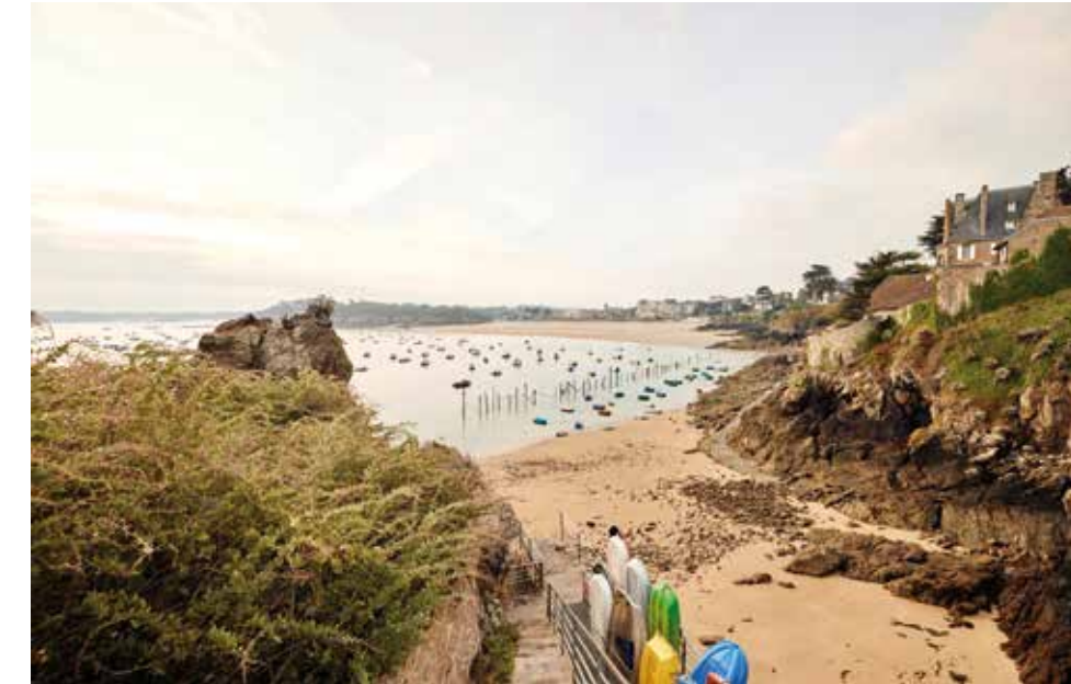
Am überwachten Strand «La Grande Plage» von Saint-Lunaire. At the supervised beach «La Grande Plage» of Saint-Lunaire.